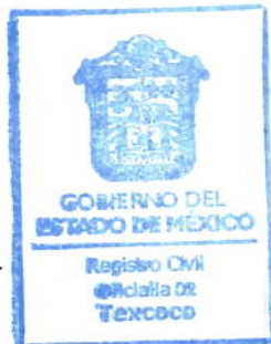
SELLO Y FIRMA DEL OFICIAL